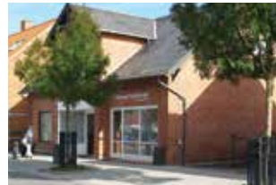
Næstved Rygcenter Storegade 10 4171 Glumsø