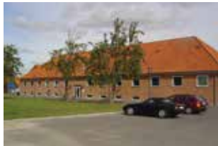
Næstved Rygcenter Eskadronsvej 4D 4700 Næstved