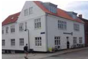
Næstved Rygcenter Købmagergade 4 4700 Næstved